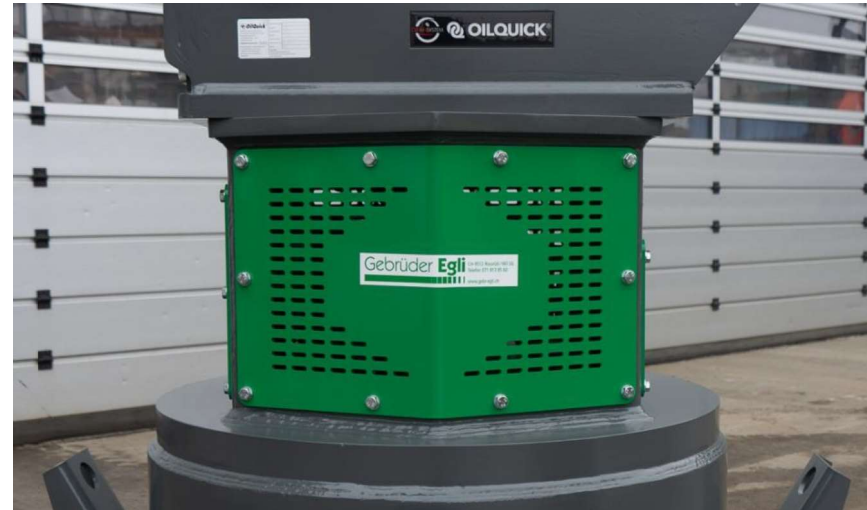
Neuer Deckel mit grösserer Schutzfläche damit der dahinterliegende Generator besser geschützt ist